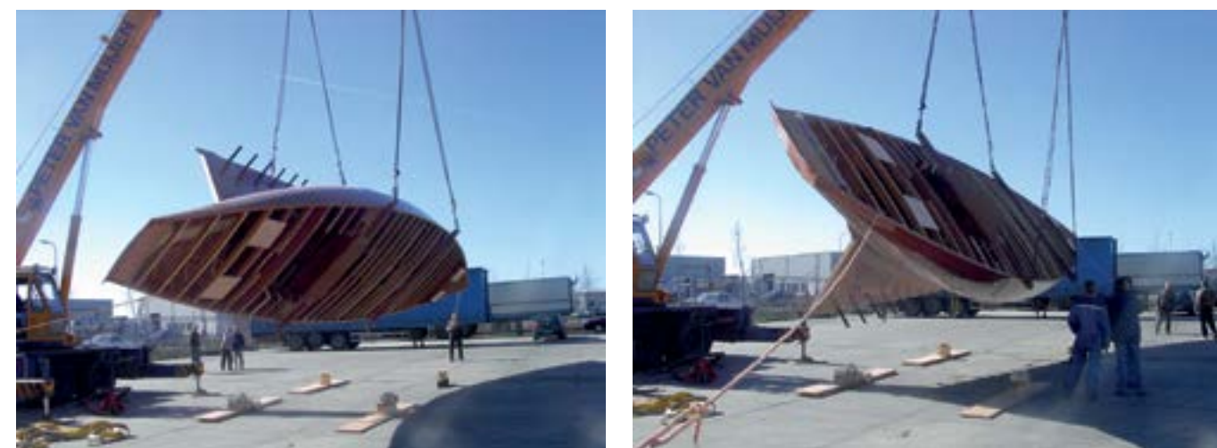
foto's van het keren van Classic Addy