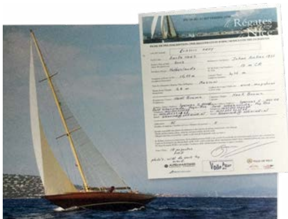
Inschrijvingsformulier wedstrijden inde Middellandse Zee

Alle elf boten en jachten dragen de naam Addy al dan niet met een toevoeging, vernoemd naar Henk's vrouw die zoals hij stelt 'dit alles mede mogelijk maakt'. Bij de VKSJ is met name de 'Classic Addy' bekend en deze wordt in het boek uitgebreid beschreven. Zowel het proces om tot een klassieker te komen die het 'Certificat de Jauge' van Comité International Mediterranee kan verkrijgen, als de bouw komen ruim aan bod. De lezer wordt vervolgens meegenomen in de (wedstrijd)zeilavonturen als het daadwerkelijk gelukt is een gecertificeerde klassieker te bouwen. In Flensburg, de Middellandse zee (Cannes, St. Tropez, Corsica, Marseille, etc.) maar ook Den Oever, Andijk, Enkhuizen en Hellevoetsluis worden de puntjes op de i gezet om mee te komen in het veld met alle klassieke mede schoonheden.