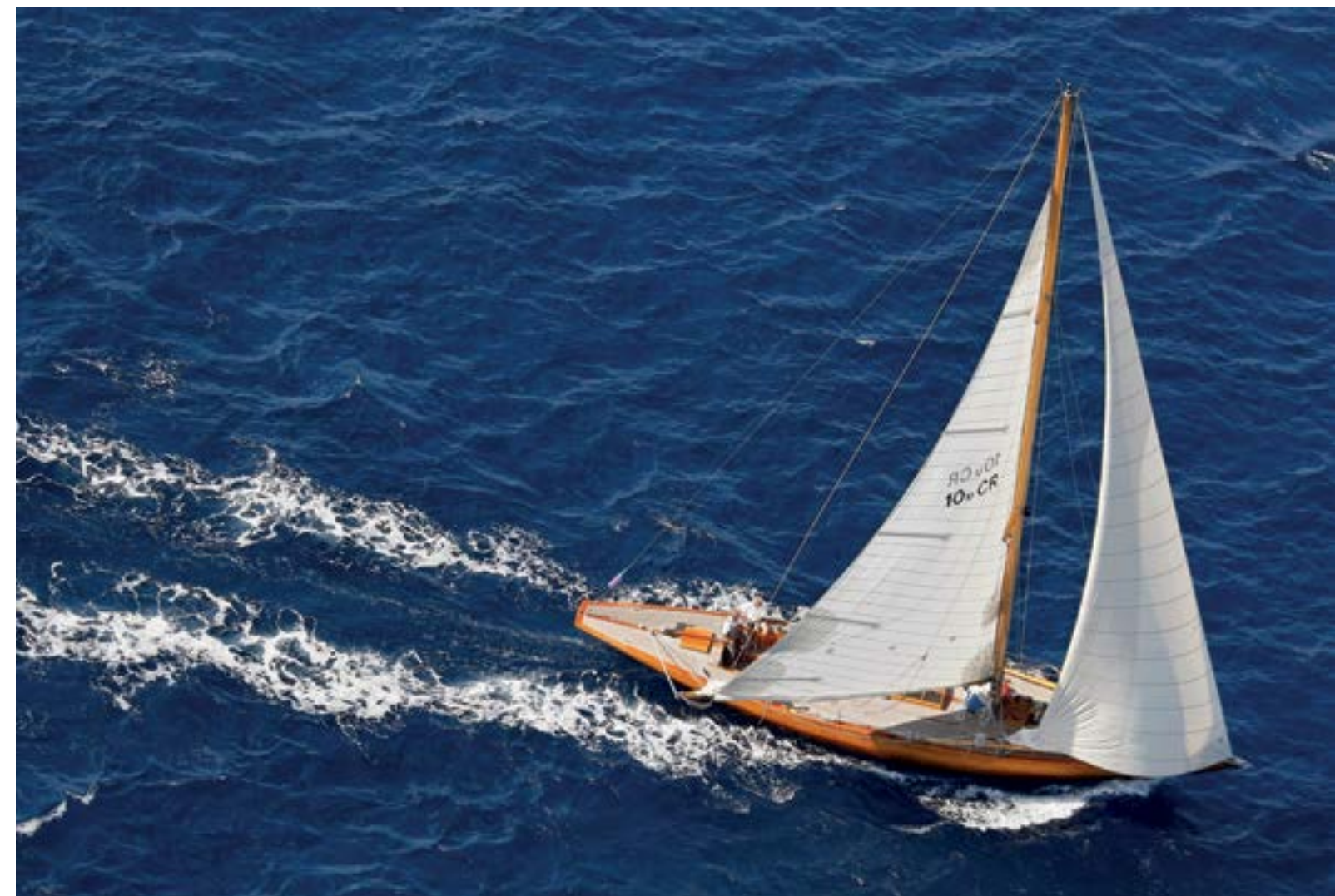
Classic Addy, met een rif in het zeil gaat het nog hard

Bij het opvragen van een exemplaar voor een korte boekrecensie bleek de belangstelling zo onverwacht groot te zijn dat de volledige eerste druk al was weggeven. Gelukkig zijn de positieve reacties voor Henk aanleiding geweest om een 2e druk uit te brengen.