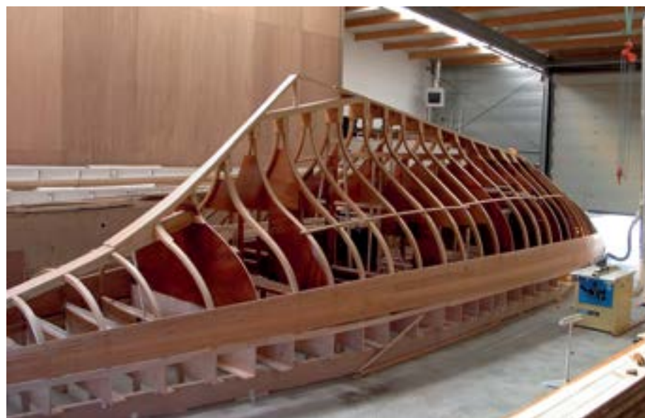
Spanten zijn gesteld, hol bol latten worden aangebracht

Daarnaast wordt ik volledig verrast door de uitgebreide context rond jachtbouw, (wedstrijd)zeilen en de maatschappelijke ontwikkelingen die in ieder hoofdstuk gegeven wordt. Zo volledig als de bouw beschreven wordt, zijn ook alle 'bijkomende zaken' waar een bouwer en (wedstrijd)zeiler mee te maken heeft meegenomen in het verhaal. Daardoor ontstaat een mooi tijdsbeeld van halverwege vorige eeuw tot nu!